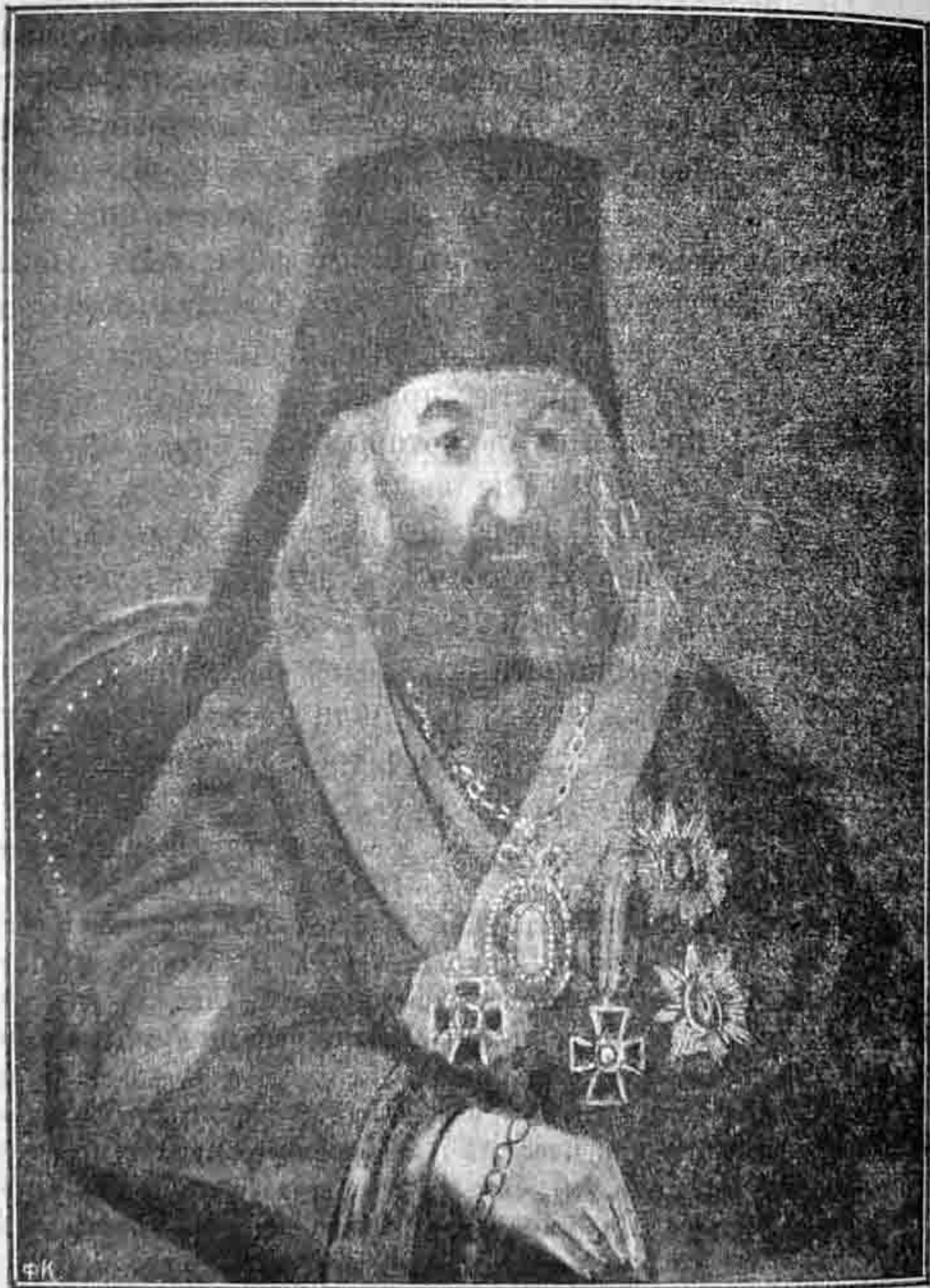
Архієпископъ Смарагдъ (Крыжановскій).

Портретъ съ оригинала Церковно-археологическаго музея при Кіевской Духовной Академіи, куда онъ поступилъ въ 1912 г. изъ Рязани чрезъ одного изъ студентовъ.