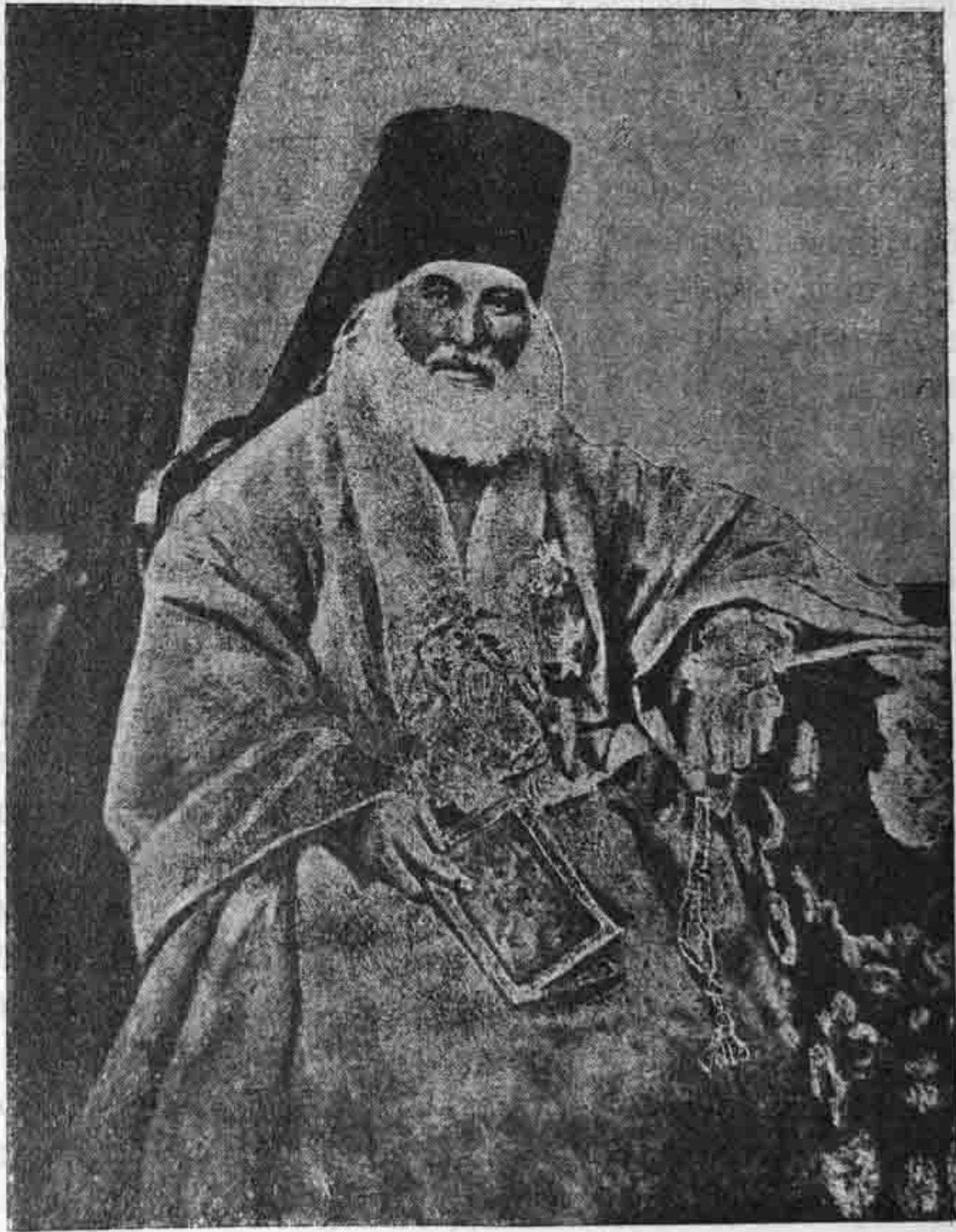
Архіепископъ Смарагдъ (Крыжановскій)

положительнаго. Думаемъ, что это ближе соотвѣтствуетъ истинѣ. Тѣмъ не менѣ нельзя отрицать у Смарагда нѣкоторыхъ влеченій къ научно-педагогическому новаторству. Мы имѣемъ свидѣтельства, что въ Кіевской Академіи первой трети про-