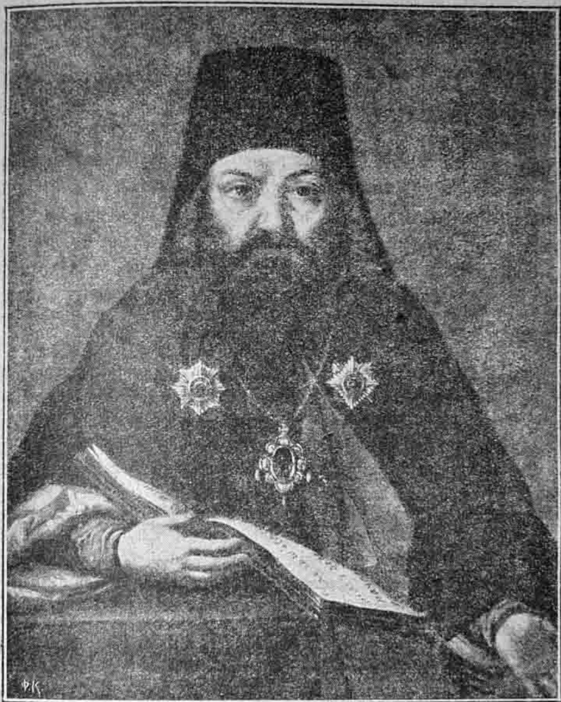
Смарагдъ (Крыжановскій), архієпископъ Орловскій и Сѣвскій.

Съ оригинала Церковно-археологическаго музея при Кіевской Духовной Академіи, гдѣ онъ записанъ такъ: „небольшой портретъ архієпископа Рязанскаго Смарагда Крыжановскаго, 1848 г., на клеенкѣ, отъ графа М. В. Толстого“ (см. у проф. Н. И. Петрова, Указатель Церковно-археологическаго музея при Кіевск. Дух. Акад., изд. 2, Кіевъ 1897, стр. 167—168, № 4.823).