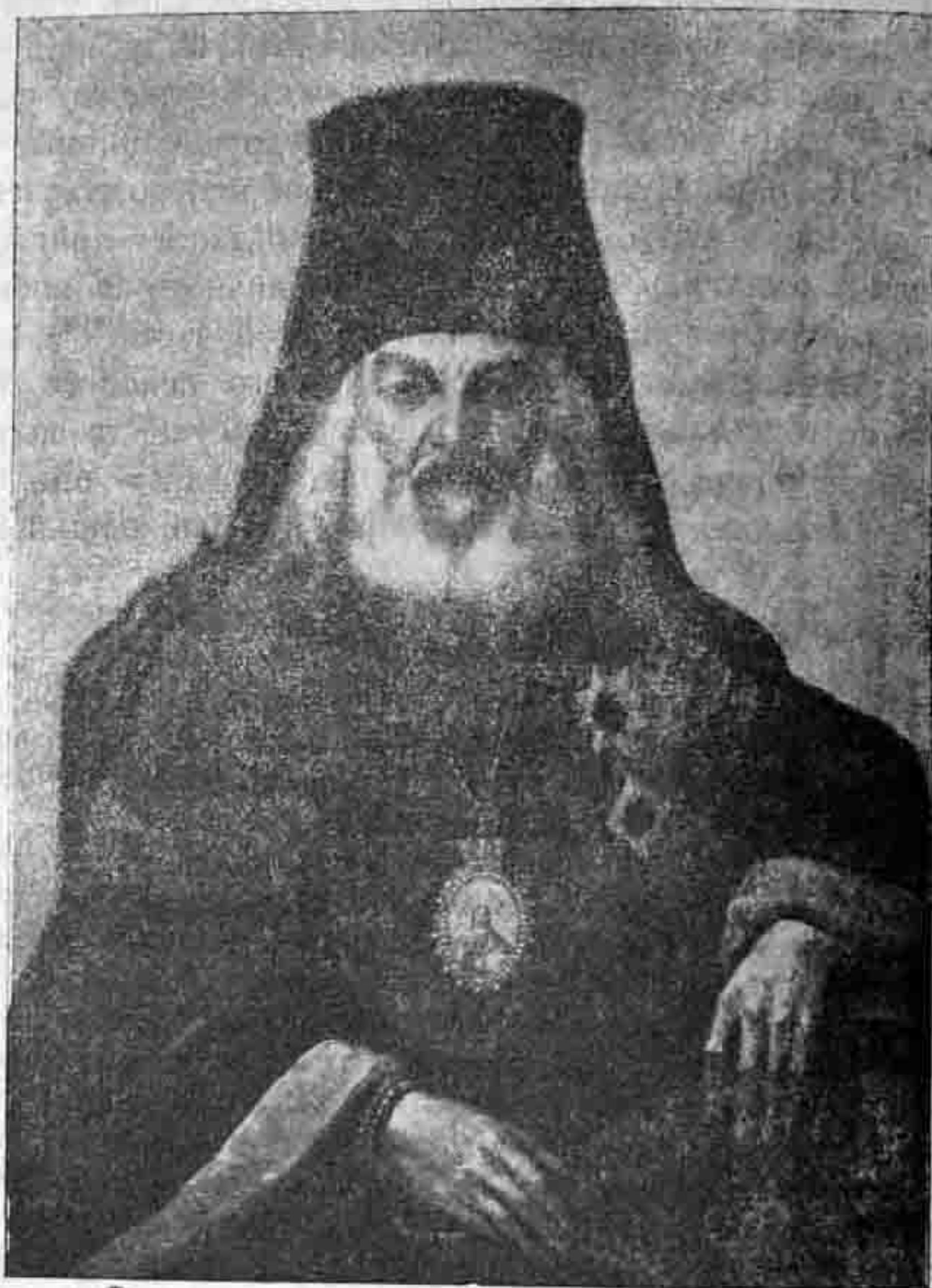
Архієпископъ Рязанскій Смарагдъ (Крыжановскій).

лицейскаго чиновника «снять шапку у этого дурака» 110) , а въ Орлѣ чопорную губернаторшу княгиню Трубецкую, рож-