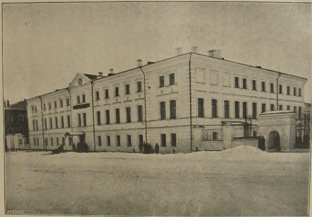
Корпусъ казеннаго общежитія Владимірекой дух. семинаріи.