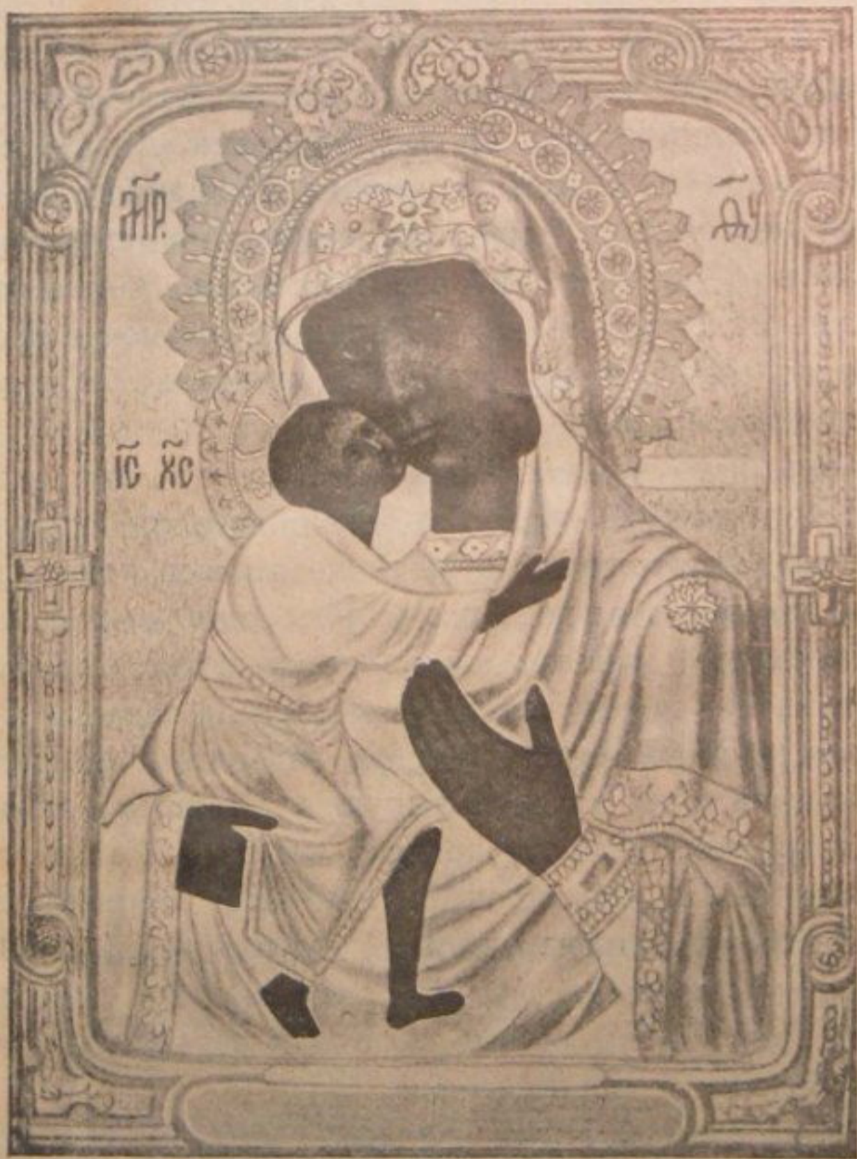
Теодоровская икона Божіей Матери въ Рязанскомъ Троицкомъ монастырѣ.

Составляющая нынѣ чтимую святыню рязанскаго Троицкаго монастыря и прославившаяся за послѣдніе