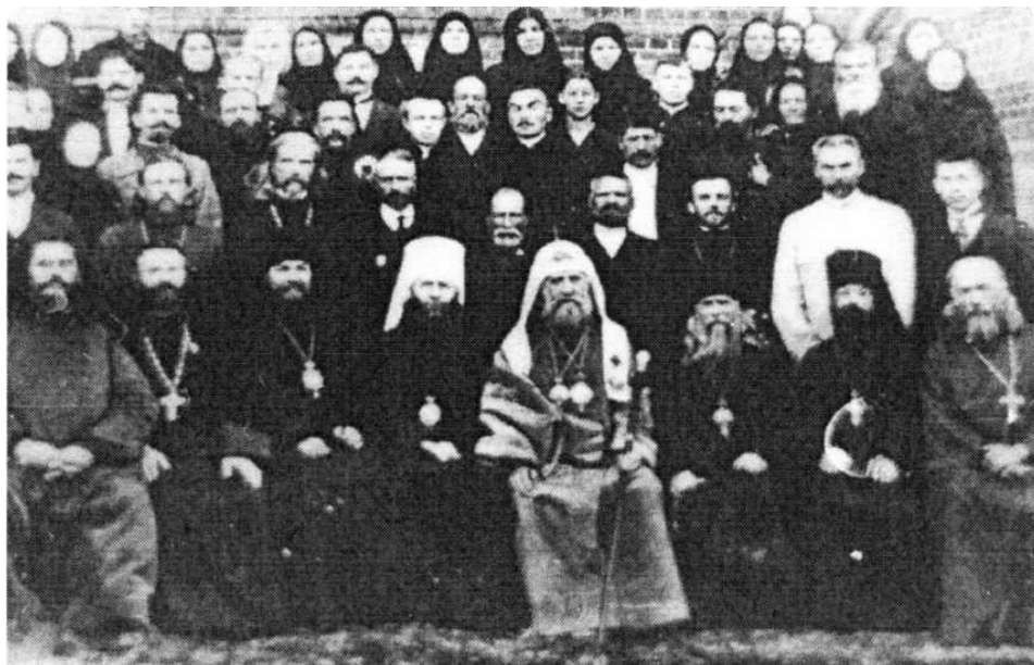
Патриарх Тихон у Введенского храма

В 1918 г. Иваново-Вознесенск посетил Святейший Патриарх Тихон и совершил Богослужение во Введенском храме.