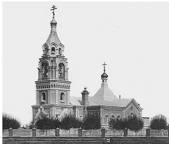
Скорбященская церковь на Дмитровке.