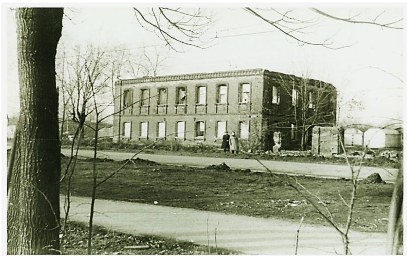
Церковноприходское Кирилло-Мефодиевское училище

В 1885 году при церкви открыли «Образцовое двухклассное церковноприходское Кирилло-Мефодиевское училище». Кирпичное двухэтажное здание было выстроено на средства «Братства святого благоверного князя Александра Невского» - церковной просветительской и благотворительной организации.