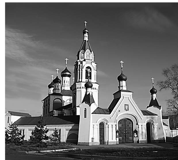
Современный вид храма