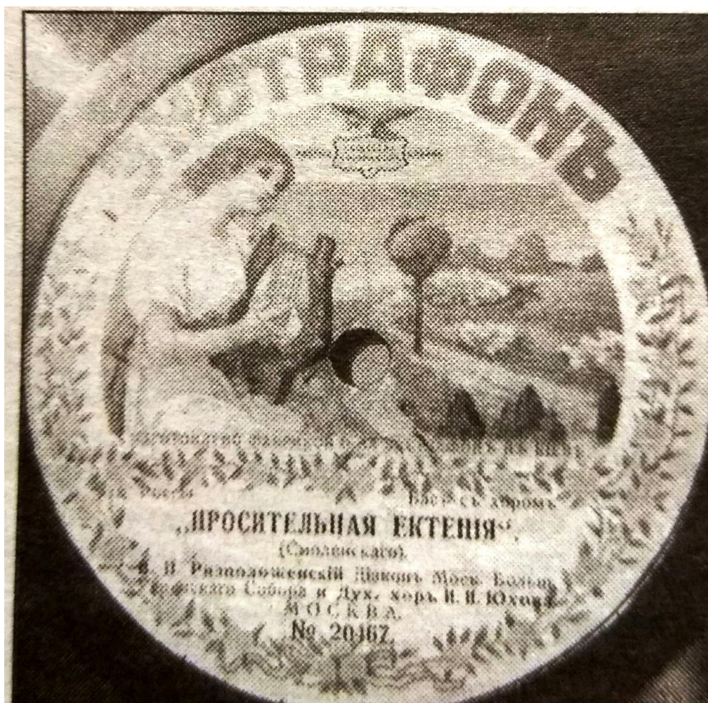
Пластинка с записью голоса В. П. Ризположенского и хора И. И. Юхова