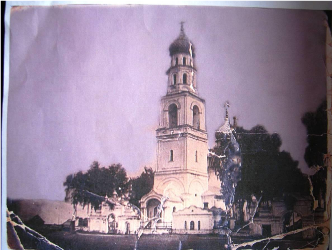
Никольская церковь села Гольчиха.