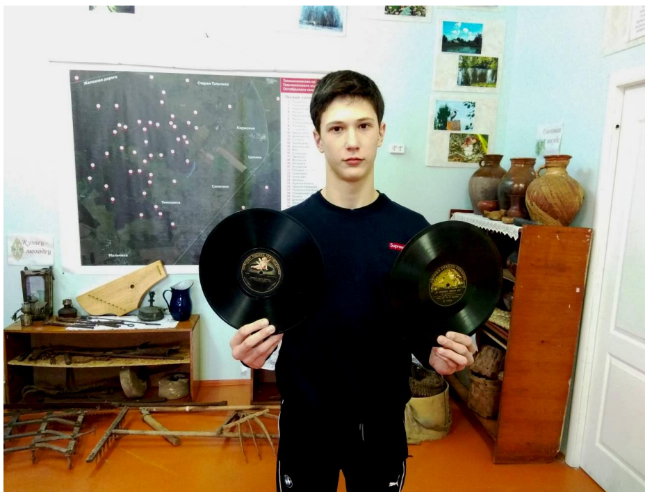
Во время прослушивания в школьном музее