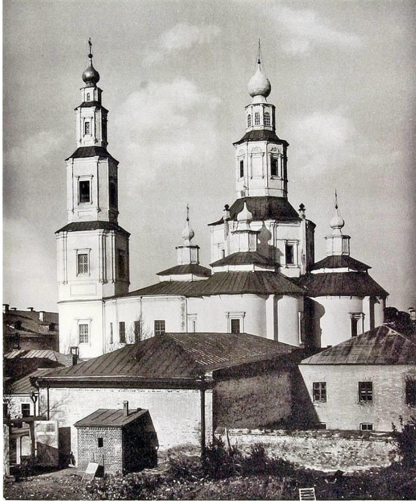
Крестовоздвиженский монастырь в Москве где поселилась семья диакона